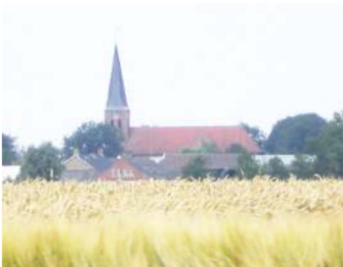
Gronings landschap in de omgeving van Wehe den Horn (Hoge land)