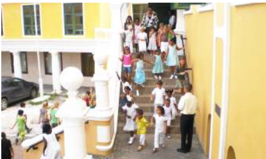
De VPCO dienst in augustus in de Fortkerk