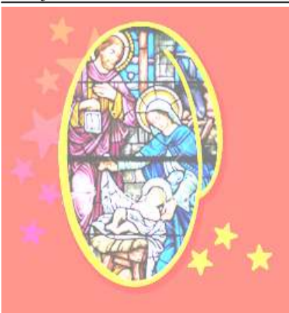
Glas in lood: Het kindje Jezus.

de tempel geleid, alwaar hij in het kindje de Verlosser zag. Anna (of Hanna) was een profetes die in de tempel woonde en op genoemde dag Simeon bijviel in zijn lof.