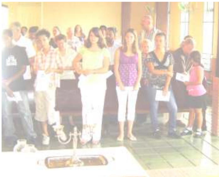
Een aantal van onze jeugdleden die de jeugddienst op 2 november hebben georganiseerd.

Dus buigen wij ons aanbiddend neder voor U, onze Heer en God! Aan U vertrouwen wij ons leven, de toekomst