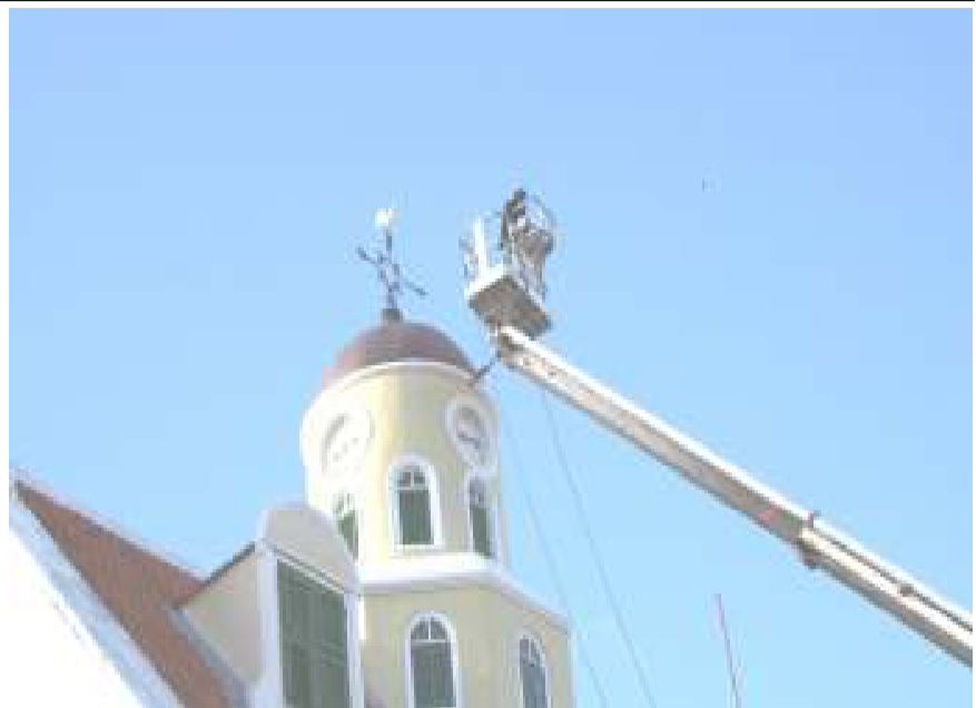
Het werk is geklaard en de haan staat er weer trots en fier bij.