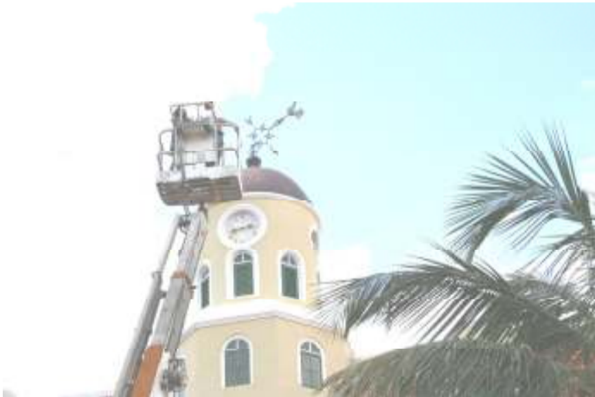
Met behulp van een hoogwerker kon een lasser naar boven en op de koepel gaan staan.

Namens de kerkvoogdij wensen we iedereen hele fijne feestdagen toe, een gezegend kerstfeest en plezierige jaarwisseling. Daarbij zijn onze wensen vooral gericht op onze dominees voor wie de decembermaand een extra belas-