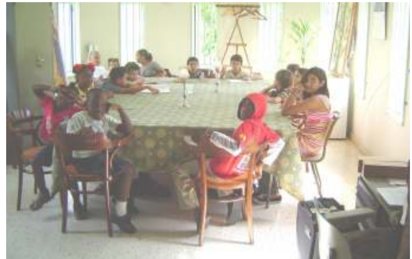
De kinderen in afwachting van de kindernevendienst in de consistorie.