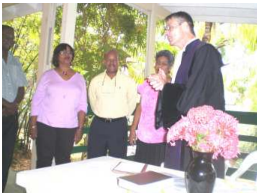
hofdienst 7 december

N a een bruisende kerst en nieuwjaarsperiode gaan we weer volop vooruit het nieuwe jaar in. In de afgelopen tijd maakten we veel bijzondere dingen mee: wel heel onverwacht en bijzonder was