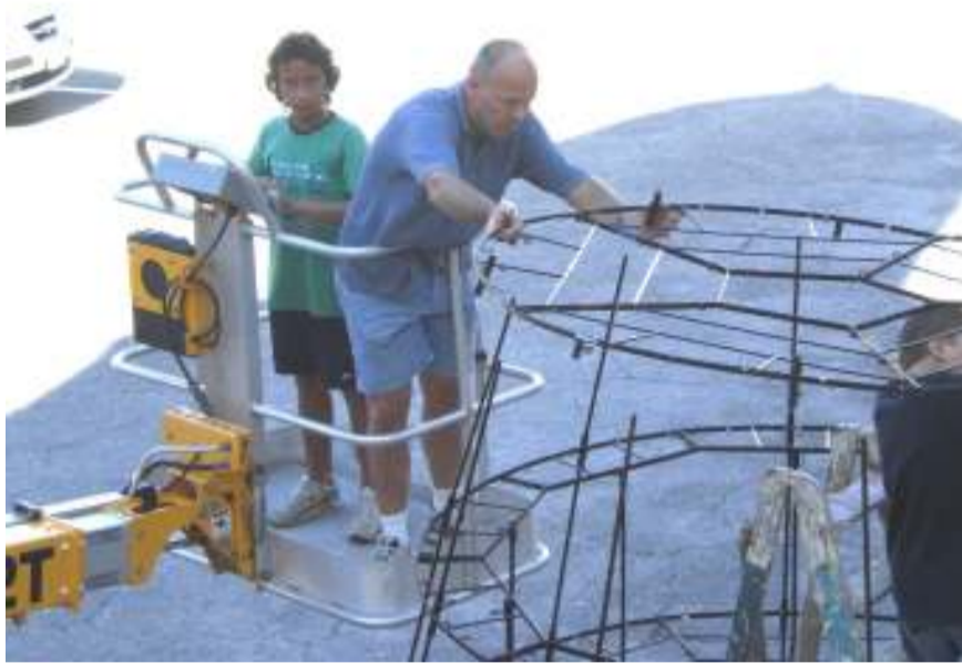
noeste arbeid van vader en zoon Jukema om de kerboom 'op te bouwen.'

dochteren zeer goed werd verzorgd, ging zij toch heen.