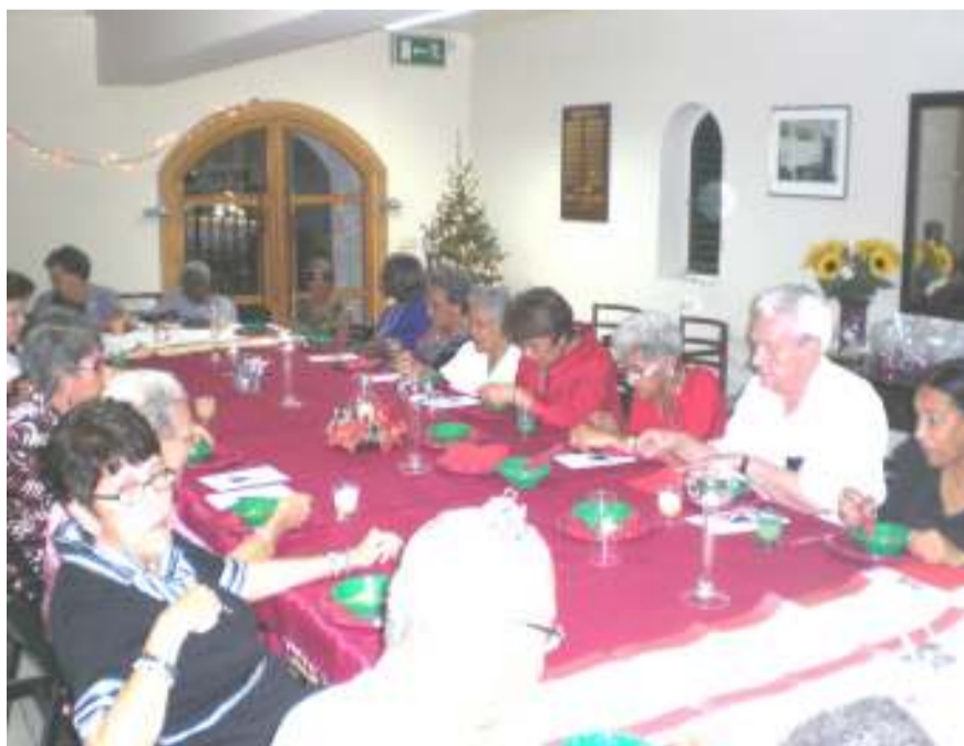
seniorenkerstfeest in Fort op 19 december

de kerstnachtviering die van start ging op het Fortplein maar die eindigde IN de Fortkerk. Nog nooit regende het zo hard TIJDENS de kerstnacht dienst. Het was natuurlijk ontzettend jammer voor al die mensen die