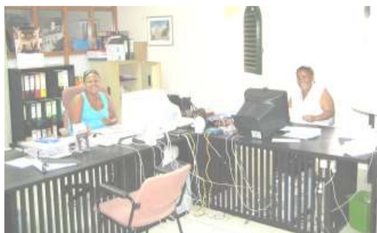
Cicely en Gloria van het kerkelijk bureau