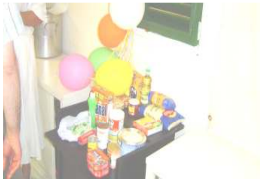
Deel van de tentoonstelling