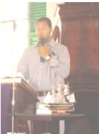
Voorzitter Seafarers Center

houden wordt. In de kerkdienst wordt op deze zondagochtend extra aandacht gegeven aan een organisatie of persoon die van tevoren door de Diaconie is gekozen, terwijl de andere organisaties na de kerkdienst een expositie houden en informatie geven over hun doelstelling. Zo werd dit keer op zondag 29 maart jl. de Seafarers Center op