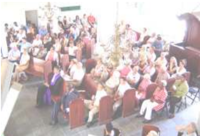
Een volle Fortkerk

De eerste diaconiezondag werd in oktober 2006 gehouden. Op deze zondag staat de Diaconie stil bij het diaconale werk dat door verschillende organisaties op Curaçao gedaan wordt. Niet alle organisaties, waar de Diaconie van de VPG contact mee heeft, zijn bekend bij alle gemeenteleden en bezoekers van onze drie kerken. Met name om deze reden heeft de Diaconie in 2006 besloten een diaconiezondag in het leven te roepen. De bedoeling is dat de diaconiezondag ieder jaar ge-