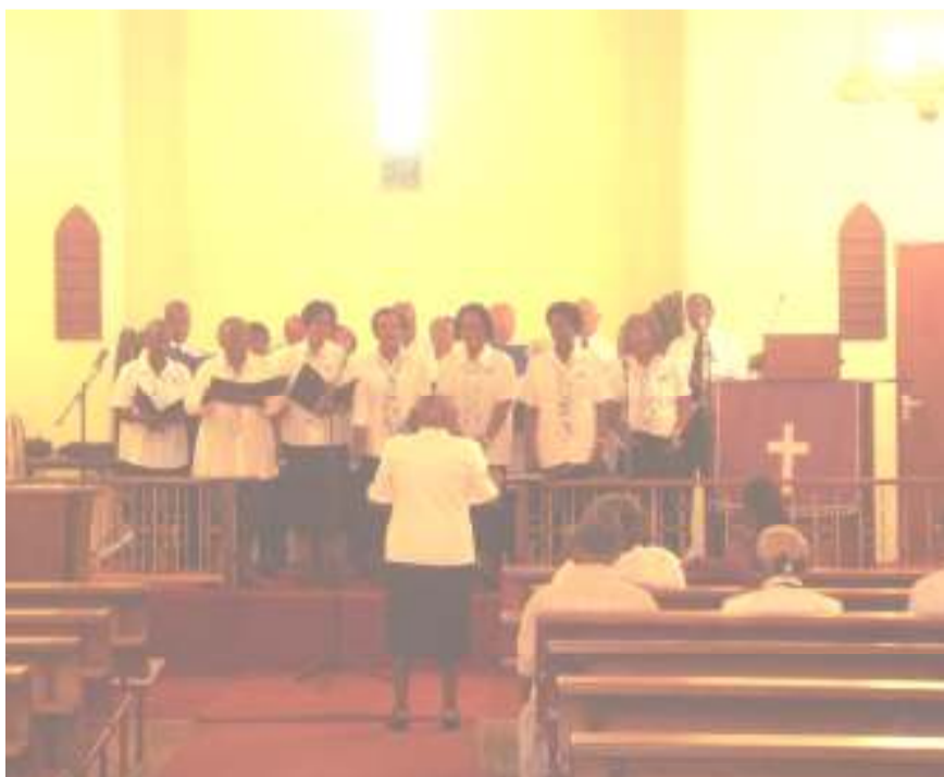
The auxiliaries of the Ebenezer Church performed at the Easter Cantata, held in the evening of Palm Sunday. The Cantata was a success and all the groups performed fabulously.