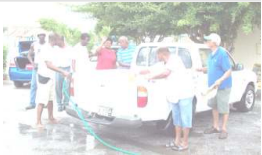
On March 28 th the Men's Fellowship held a Fundraising carwash in the yard of the Ebenezer church. This was a success.