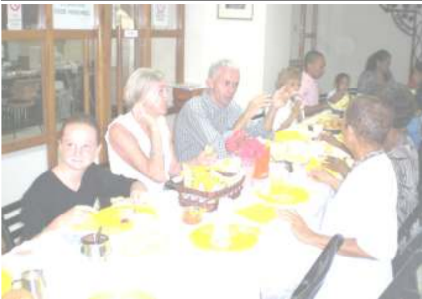
Het paasontbijt was reuzegezellig en zeer goed verzorgd door onze diaconen in samenwerking met enthousiaste gemeenteleden. Daarna gingen we uitbundig pasen vieren tijdens de kerkdienst. Het Fortkerk Koor (Forti Kantando) zong samen met de gemeente het paaslicht te wereld in.