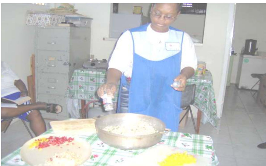
The Ebenezer Women's Group

promové desaroyon an edukashonal, kultural, sosial, deportivo i spiritual. E programa ku e fundashon lo konsentrá riba dje ta: krèsh pa mucha te ku 4 aña, naschoolse opvang, lès di arte, lès di músika, lès di kushina, deporte, lès di kòmputer, desaroyo soshal, moral i spiritual, i liderato. Nos lo hasi uso di e edifisio konosí komo Obed Anthony Hall pa e programa nan. Den luna di yùni nos lo partisipá e aktividatnan ku lo bai tuma lugá i nos ke invitá tur hende pa laga nan yunan partisipá na e aktividatnan.