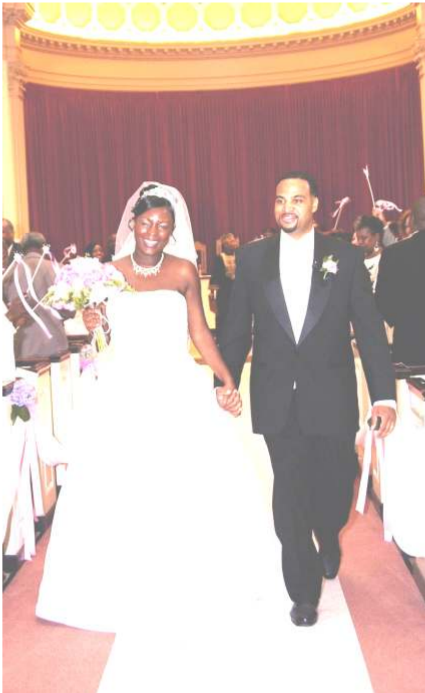
Traditional Opposite Sex Marriage Picture

merely granting legal status of marriage to same-sex union does not and cannot make it marriage as marriage has been understood and defined since time immemorial.