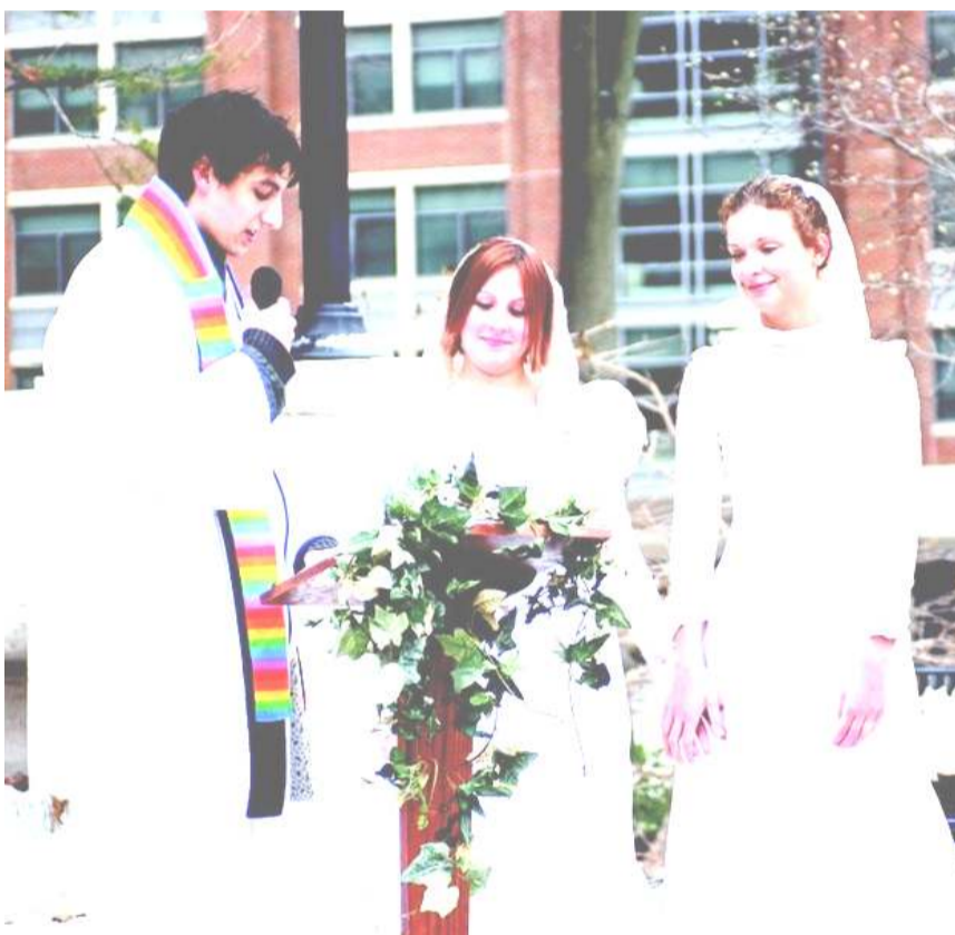
Same-sex Marriage photo

correcting a legal injustice against proponents of same-sex marriage which formerly denied them constitutional right to equal protection, another legal injustice is not being committed against "recorders" who may choose not to adhere to the new legal ruling for reasons of belief and conscience.