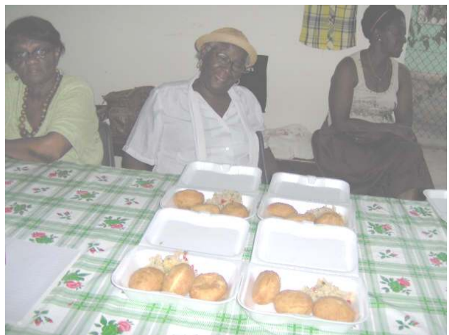
The Final Result