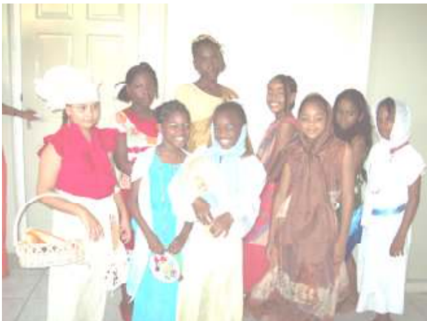
The Watermelon Group

i artista ku tabata biba den bario di Oranjestraat, a wòrdu lanta pa traha riba tereno di hubentut di bario nan Oranjestraat, Penstraat, Cher Asile, Monte verde, Bont, Steenrijk, Maripampun i bisindario. Meta di e fundashon ta pa