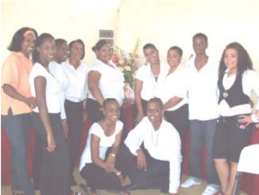
The New Generation Youth group

The Ebenezer Church is blessed with various groups or Church