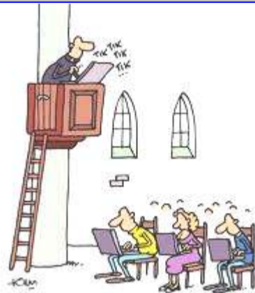
PREKEN VIA MSN...

De identiteit van een school zou je kunnen opmaken uit wat er staat in de statuten en hoe dat