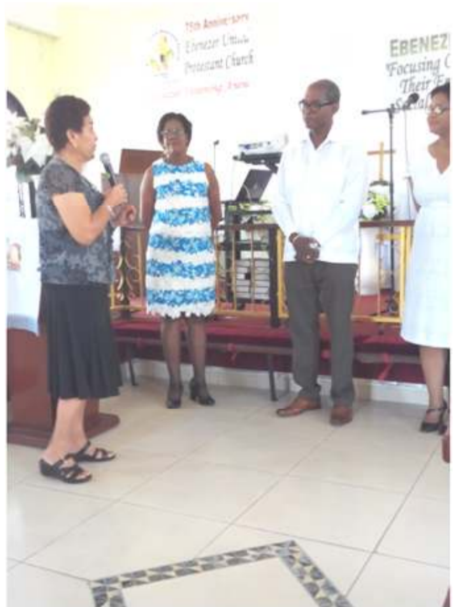
Commissioning & Installation Rite as Elder of the Ebenezer Church and as Chairman of the UPC(VPG), Sunday February 7th, 2016