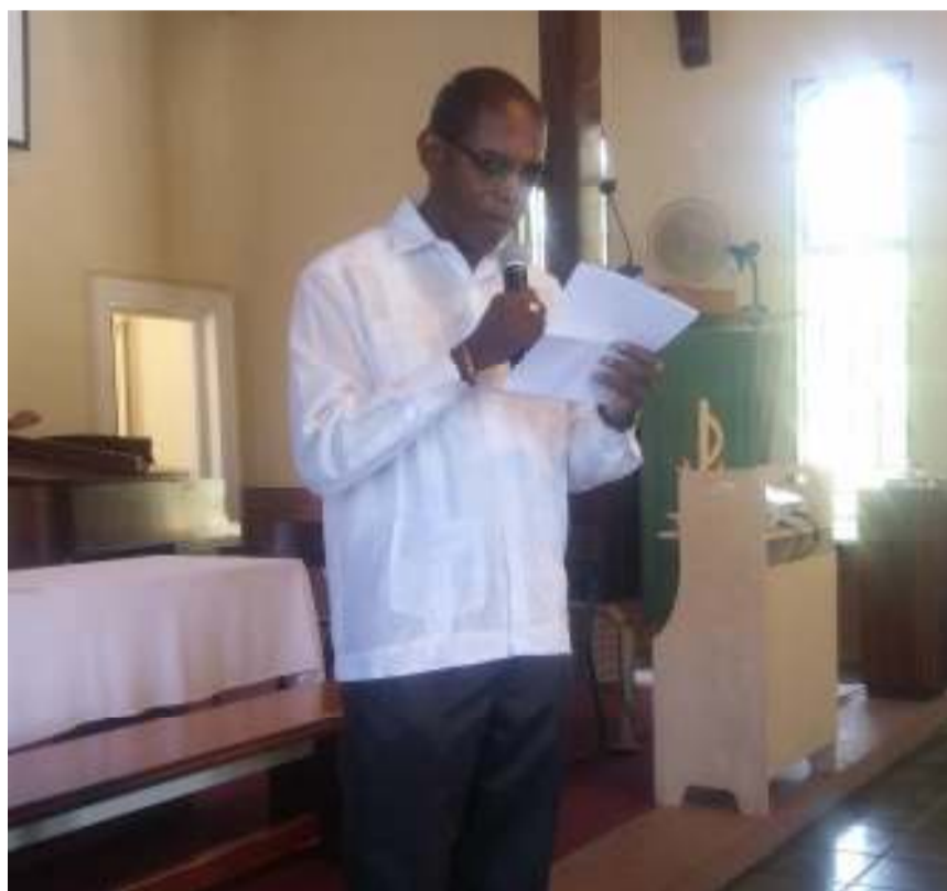
De nieuwe preses van de VPG tijdens zijn kennismakingswoord