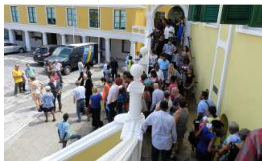
De kerkgangers verlaten de Fortkerk na de VPCO startdienst