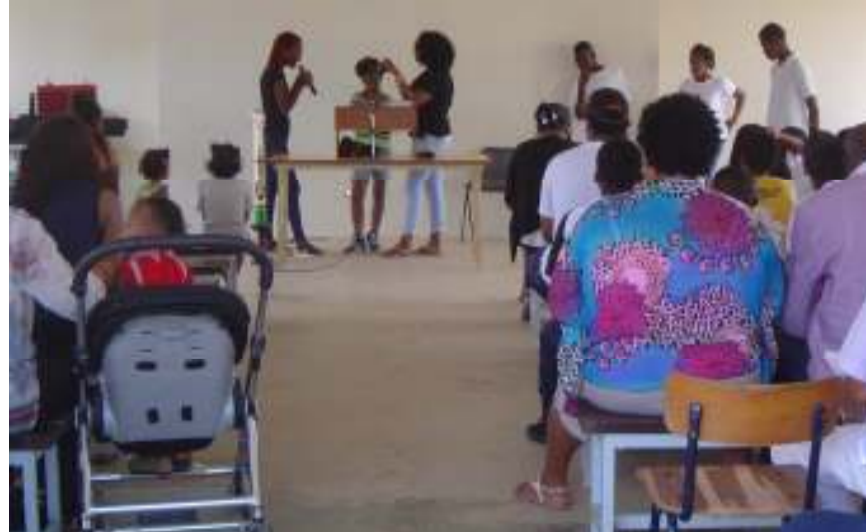
Presentaties door de jeugd tijdens de afsluitingsdienst op 17 juli