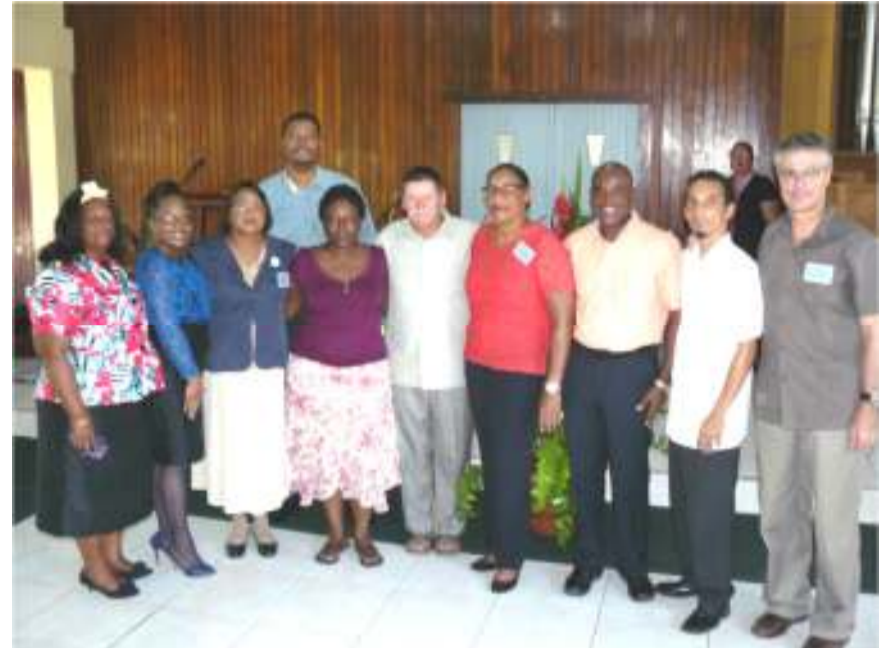
Foto: Enkele deelnemers aan de conferentie in de Morgensterkerk