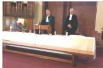
Twee heren dienst

Doet u dan het volgende: Lever uw oude leven in bij het kruis van Golgotha. Bied eerlijk uw zonden op, vertel ze aan de Heer en geef uzelf over aan Hem, die gezegd heeft: "Zo is dan wie in Christus is een nieuwe schepping: het oude is voorbijgegaan, zie het nieuwe is gekomen". God wil er ook voor U zijn, Hij wil er weer iets moois van maken. Hij wil u wassen van uw zonden." Komt toch en laat ons tezamen richten, zegt de HERE; al waren uw zonden als scharlaken, zij zullen wit worden als sneeuw" (Jesaja 1:18).