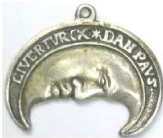
geuzenpenning in de vorm van de halve maan.

Toch is het juist de samenleving van Indonesië - met het grootste aantal mosliminwoners ter wereld welke een sterke voorkeur heeft voor de harmonie van de ongelofelijke verscheidenheid aan godsdiensten, culturen en etnische achtergronden binnen haar grenzen. De oude Javaanse tradities benadrukken in muziek, dans, dichtkunst de eenheid; de Javaanse way of life is vooral overeenstemming hebben met je omgeving. Pas bij de Nederlandse kolonisering in het begin van de 19e eeuw werden werd etniciteit, godsdienst en cultuur onderscheiden naar het model van de toen geldende Nederlandse context. Maar verzuiling was in de Indische samenleving ongekend! Zo werden verschillen benadrukt in de oprichting van etnisch bepaalde kerken, maar met de islam wist de Nederlandse overheid geen raad en kreeg daarom een gedoogstatus. Onder de invloed van de Hollanders werd het har-