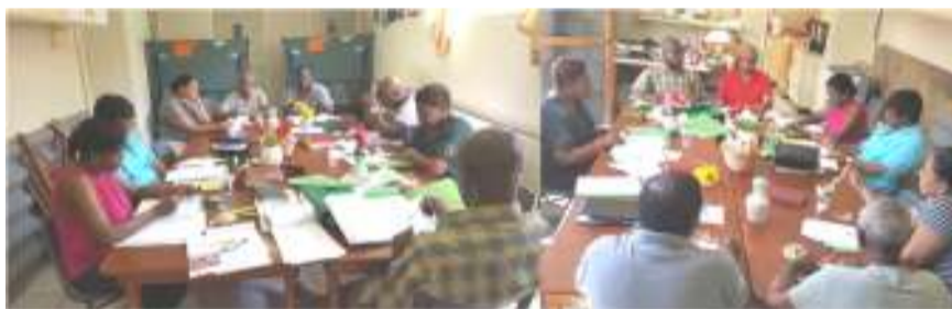
Ebenezer Church board retreat

Among the topics discussed was the matter of being committed to the Church which we take great pleasure in sharing with you.