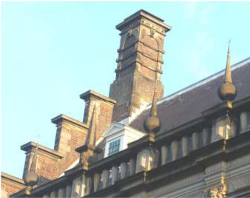
fragment Leidse stadhuis; halve maantjes op torentjes

De noodzaak om na te denken over de relatie van het christendom en de islam is zeker niet alleen van deze tijd. Terreur, geweld en intolerantie kende men ook in de 17e eeuw. Bekend zijn de gewelddadige acties in reactie op de reformatie (inquisitie) die voornamelijk gekenmerkt werd door de vermeende superioriteit van de (toenmalige) Roomse Kerk. Naast alle misstanden en onbijbelse gegevens waartegen de reformatie zich (terecht) heeft afgezet, protesteerden de reformatoren ook (wellicht nog veel meer) tegen de agressieve vorm van intolerantie van kerk en staat tegen alles wat niet-Rooms was. De Beeldenstorm in de 16e eeuw kwam niet tot stand vanwege verschillen in de leer of godsdienstige opvattingen, maar tegen de niet nagekomen belof-