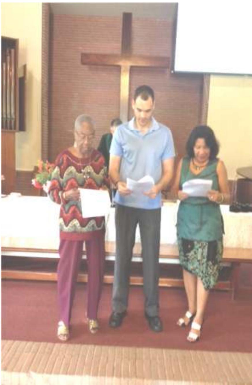
Onze jarigen op 19 februari