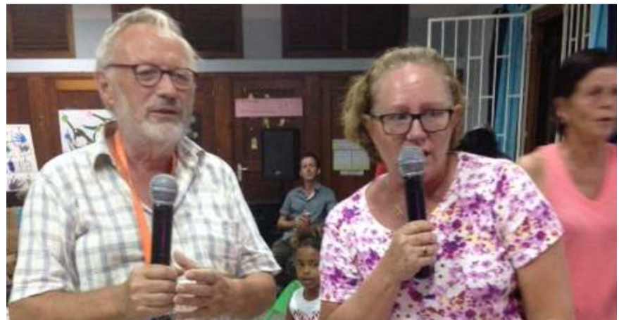
Karaoke tijdens de Potluckmiddag