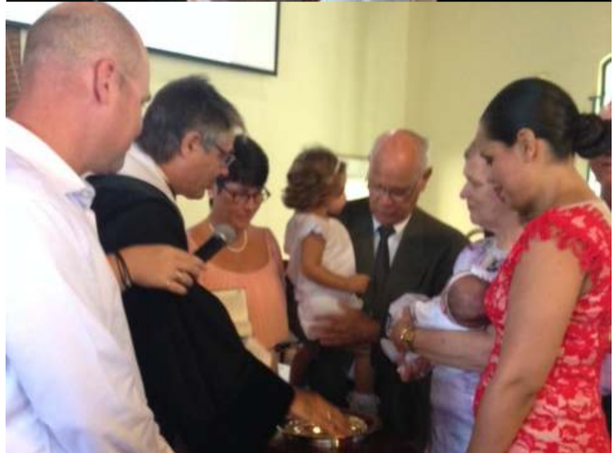
Belijdenis en Doop