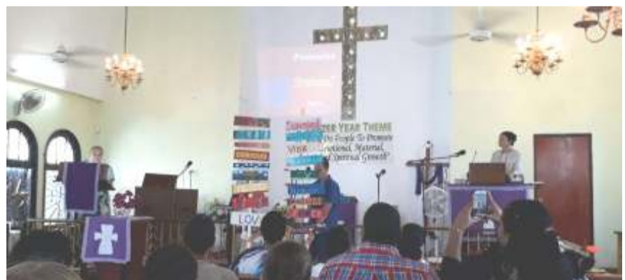
De Jeugddienst in de Ebenezer Church