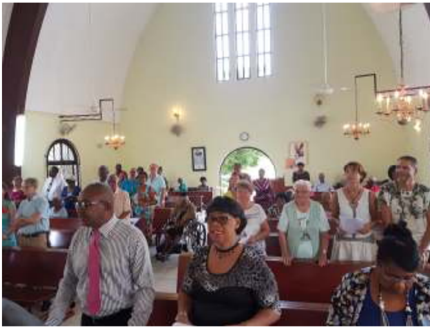
Images of the Youth Service of 19 March 2017

deeds to our fellow human beings, especially, "the least of these," looking forward to Christ's great sacrifice on Good Friday and his victorious resurrection on Easter Sunday. As I am about to conclude this sharing, a thought, profound it seems, has come to me which I feel compelled to share, here it is: "If our basis or reason for Church is not love for God and acceptance of Jesus Christ as Saviour and Lord of our lives, then there will not be that commitment, will, enthusiasm and passion that are all vital to the sustenance and success of Church, for the traditional, reasons or motivations, such as for example traditional family mores or practice can no longer suffice, in our changed world, to maintain love and loyalty to God and his Church."