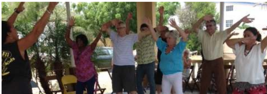
Zumba dansen te Lagun

Het kinderkoor zong. Plotseling rolden tranen over Bart's wangen. Hij dacht weer aan Ria en Ankie. Met enkele buurkinderen hadden ze de kinderclub een poosje bezocht. De versjes, die ze daar geleerd hadden, hadden ze thuis ook gezongen. Kon hij zijn meisjes maar weer eens zien! Maar Bart wilde zelf niet, dat ze hem in de gevangenis zouden zien. En Gerrie sprak met hen zo min mogelijk over de plaats, waar Bart nu was... Bart luisterde weer naar het koor. "Op het heerlijk Pinksterfeest, schonk de Heer Zijn Heil'ge Geest..." Bart's schouders schokten. Hoe kon, in een plaats als deze, van een Heilige Geest worden gezongen! Er werd in de kerk vaak over heiligheid gesproken, maar hier was niets dan zonde en zwarte misdaad. Het laatste lied was gezongen. De leidster werd met haar koortje naar de kantine gebracht en Bart mocht bedienen. Hij zag de wat verlegen meisjesgezichten, eigenlijk was het hier voor hun geen plaats. En toch zei Bart tegen de leidster, dat hij het koortje zo graag nog eens wilde horen. "Later misschien! Maar, al gaan wij nu weg, de Heilige Geest wil hier blijven", zei ze zichtbaar ontroerd. Even later verliet ze met de kinderen het gebouw. Ze gingen de vrijheid weer in. In zijn cel dacht Bart na. Een geestelijk verzorger bezocht hem zo nu en dan. Hij had gezegd, dat niemand, niet één, uit zichzelf goed deed. En dat zich niet alleen binnen,