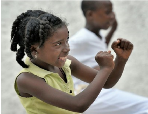
Children practice capoeira in a camp for homeless families in the Belair section of Port-au-Prince, Haiti. 2010

The Caribbean: Antigua and Barbuda, Bahamas, Barbados, Cuba, Dominica, Dominican Republic, Grenada, Guyana, Haiti, Jamaica, Puerto Rico, St Kitts-Nevis, St Lucia, St Vincent and the Grenadines, Suriname, Trinidad and Tobago