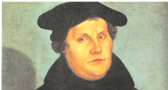
Afbeelding: Maarten Luther