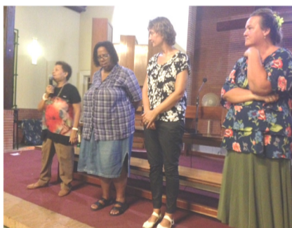
De diakenen op de VPG Gemeenteavond

Want dit Kind uit de hemel gekomen, is en blijft de hoop van onze dromen.