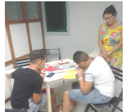
Foto's van de voorbereiding