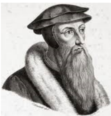
Afbeelding: Johannes Calvijn