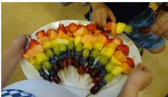
Regenboogsticks, ook het eten kun je met het thema mee laten gaan