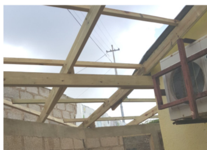
The ongoing extension of the Wesley Hall

The expansion of the Wesley Hall has begun in the meantime. The objective is to have this project concluded by March 20 th 2018 and be ready to be inaugurated and blessed during the Church's 89 th anniversary celebration of the Ebenezer Church on March 25 th 2018 (Palm Sunday).