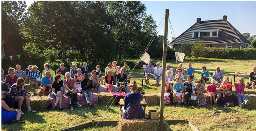
Kliederkerk in de openlucht, in Gaastmeer, Friesland