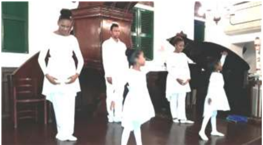
Een dans uitgevoerd door de dandgroep van de U-Turn kerk tijdens de openingsdienst van de conferentie