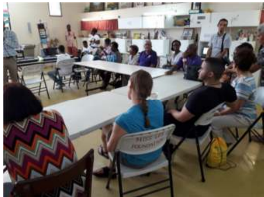
Picture of the CANACOM Delegates visiting the Miss Lee Foundation.

The CANACOM delegates visited a project funded by this organization in the Emmakerk (Project for the hearing impaired). The delegates were also treated to a boat excursion along part of the southern coast and also of the Schottegat. This boat tour was sponsored by the Curacao Ports Authority. Visits also were made to the Slave Museum in Kura Hulanda and the Miss Lee Foundation at the Ebenezer Church.