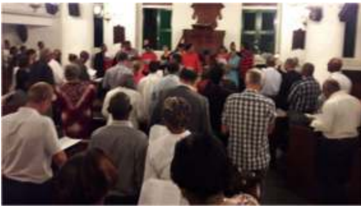
A packed Church filled with worshippers.

This brings me to a question which was raised during a lecture by a professor friend of mine in economics. The question was: "What will happen if beggars go on strike?" After not having received a satisfactory response from the audience, the professor himself answered the question: "If beggars go on strike it would upset the system". As we try to answer the above questions we should reflect on what is written in the second part of verse 8 in Micah chapter 6: "To act justly and to love mercy and to walk humbly with your God". As we read this response we realize that on our own strength it is indeed very difficult to do what is required from us in many cases, especially when it involves leaving our comfort zones and taking somewhat distance from our hard earned earthly material possessions and positions. But as it is written in Mathew chapter 19 verse 26: "Jesus looked at them and said, 'With man this is impossible, but with God all things are possible'." Once equipped with the necessary Faith, albeit the size of a mustard seed, we can boldly say, as it is written in Philippians chapter 4 verse 13: " I can do all things through Christ Who strengthens me ".