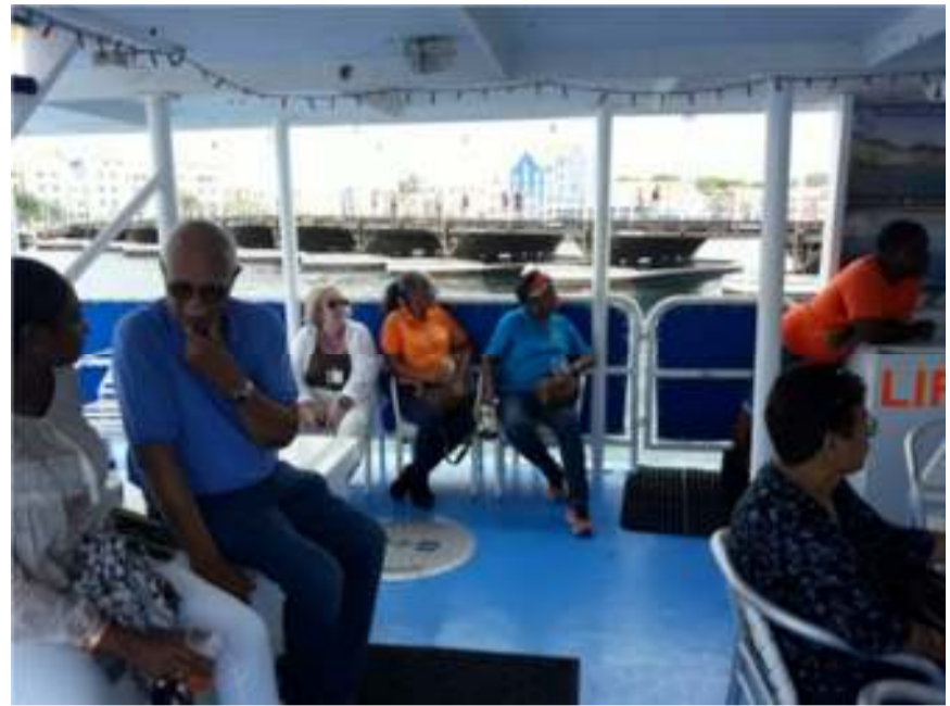
The CANACOM Delegates enjoying a boat tour.

I know that you confronted the necessary challenges whereby Murphy's Law would sometimes tend to pop up and make its presence known. I understood that all visiting and local delegates had productive meetings during the Council Meeting. The feedback which we received was that the social events and outings which were organized made the CANACOM visitors feel right at home on our Dushi Korsow .