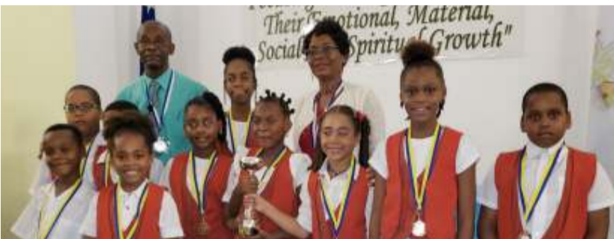
Winner group category, Ebenezer UPC