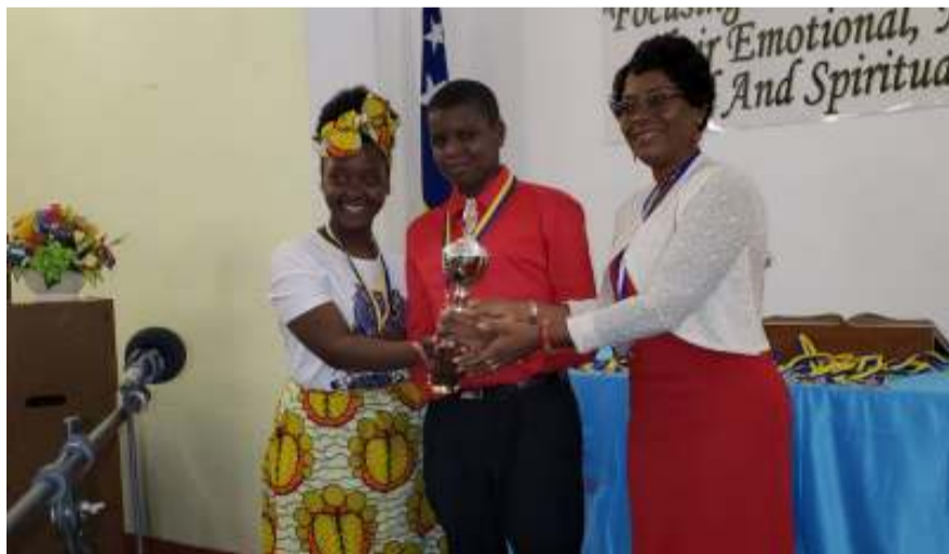
Winner duet category, Wesleyan Holiness Church