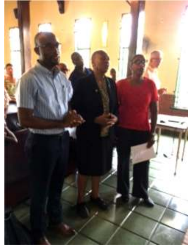
Enkele Canacom leden tijdens de eredienst in de Emmakerk