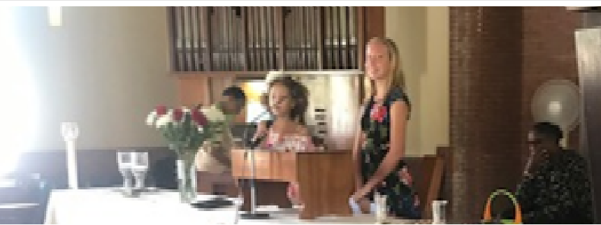
Presentatie kindernevendienst project op Vaderdag