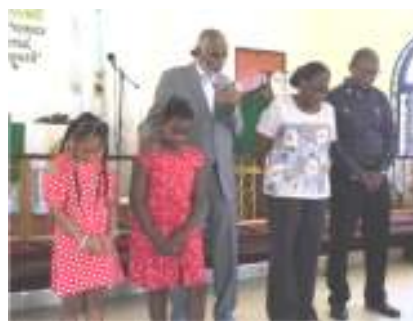
Birthday celebrants and anniversary couple

We pray that your desire to make the VPG grow in unity in Christ as Paul describes it in one baptism, one faith and one Lord come true.