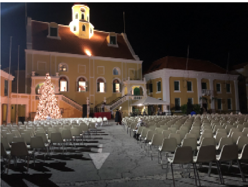
De Fortkerk en –plein vlak voor aanvang van de Kerstnachtdienst 2019