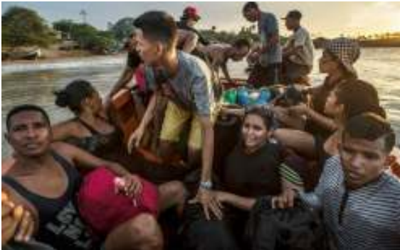
Zijn dit werkelijk criminelen? (Red.)

Het gebod om géén beeld van God te maken, maar ook niet van een ander, is allereerst de erkenning van het gevaar dat beelden voor de werkelijkheid zèlf kunnen worden gehouden. En vaak geloven we er nog in ook. Maar ook van de ander is in feite geen beeld te maken, omdat een mens nooit te vatten is in één dimensie of één trefwoord. Een beeld doet