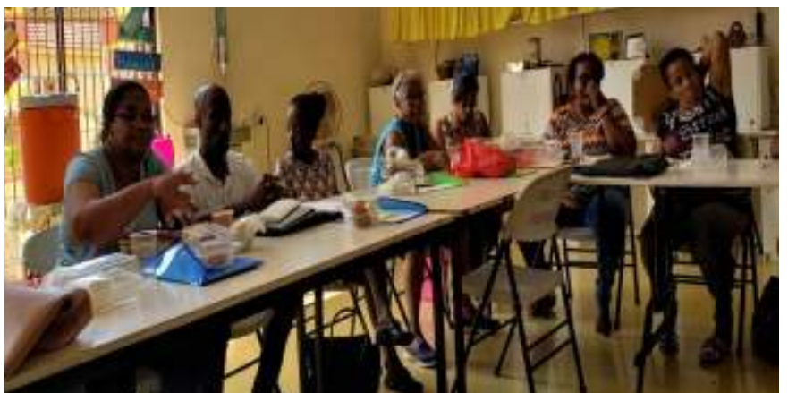
Retreat held with Board and Auxiliaries