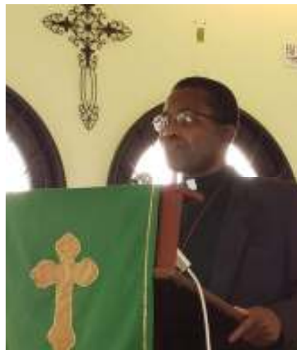
Rev. Greenaway introducing himself