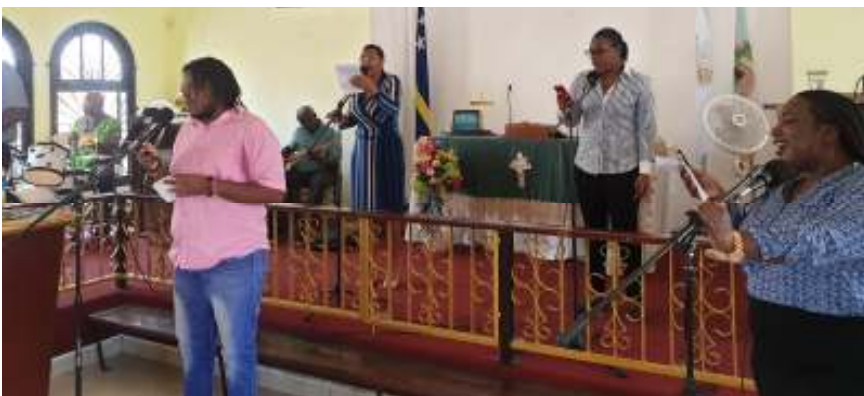
Worship team Ebenezer Church