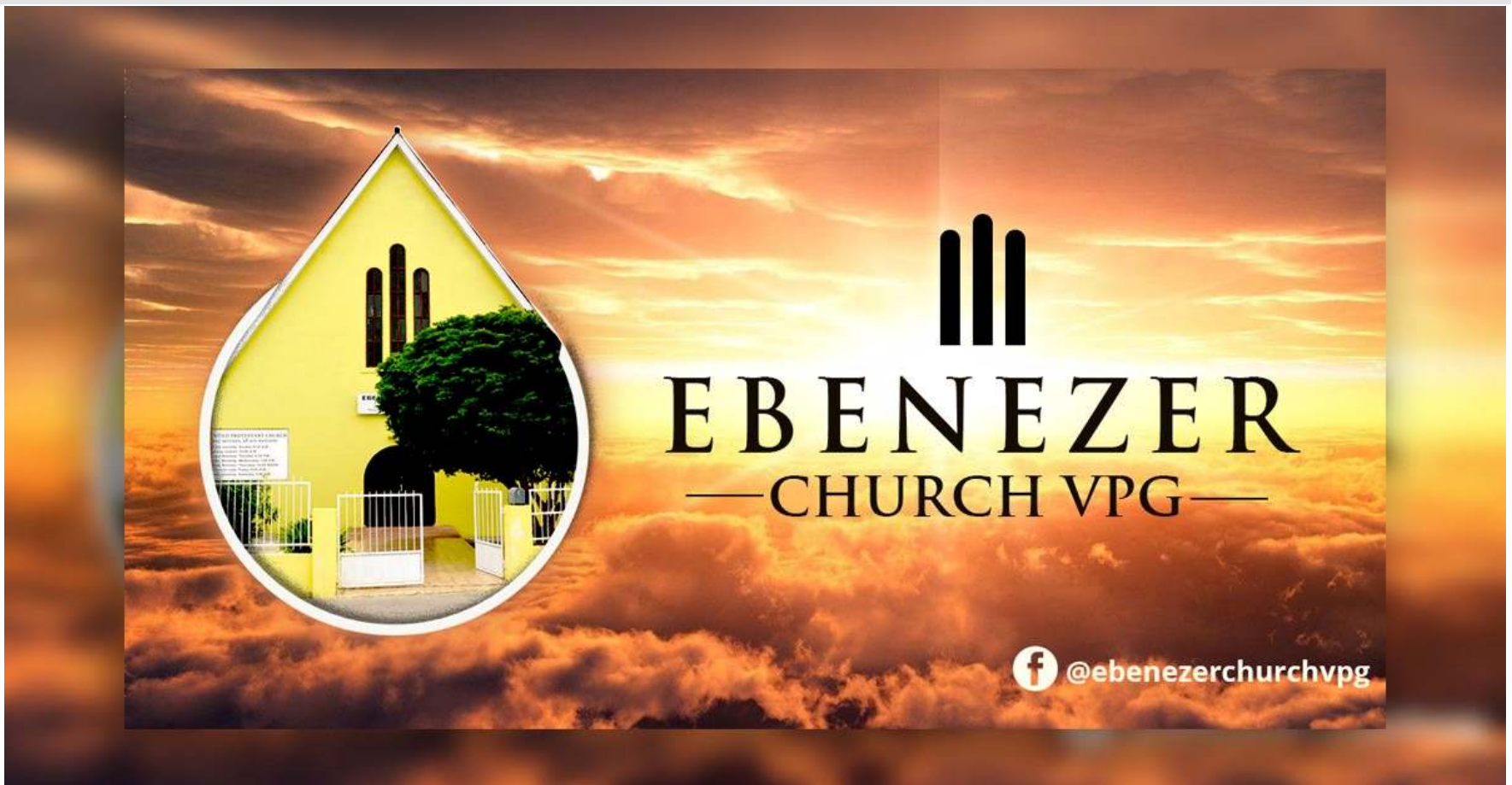
Profile image of the Ebenezer Church Facebook page