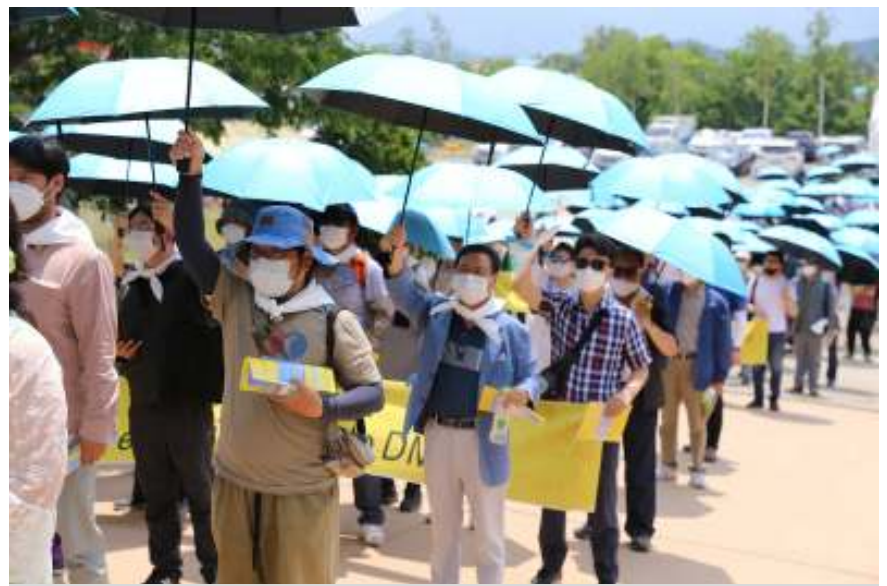
Peace convocation and march at the DMZ between the North and South Korea. Photo: Presbyterian Church in the Republic of Korea, 2020.

Following an ecumenical consultation initiated by the WCC in Tozanso, Japan, in 1984, the ecumenical movement has played an important role through prayer, cooperation for reconciliation, dialogue, and peaceful reunification.