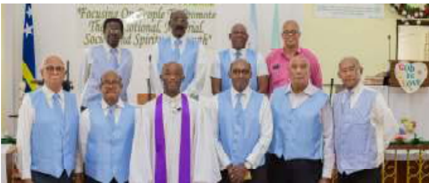
Ebenezer Men's Fellowship

days or via live streaming. The role and the participation of especially the young adults in our Church is of vital importance. As a Church Board we applaud our youngsters who every Sunday present lively and most inspiring Praise & Worship songs during our Services. The various Church auxiliaries remain essential elements in the structure of the Church and as such assist the Church in carrying out its Mission.