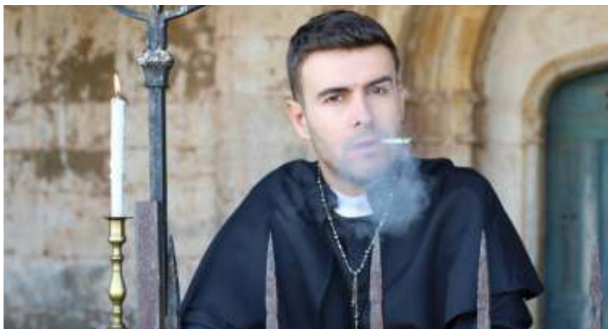
Een hippe priester

geeft, wordt hij zelf beïnvloed door die cultuur. Natuurlijk is het belangrijk om je te verdiepen in een cultuur. Je moet die cultuur begrijpen, diagnosticeren en bepaalde aspecten ervan waarderen. Maar wees niet naïef voor de risico's die zo'n cultuur met zich meebrengt (ik spreek vanuit ervaring). De vormende kracht van onze meer en meer gesculariseerde en digitale cultuur moet je niet onderschatten.