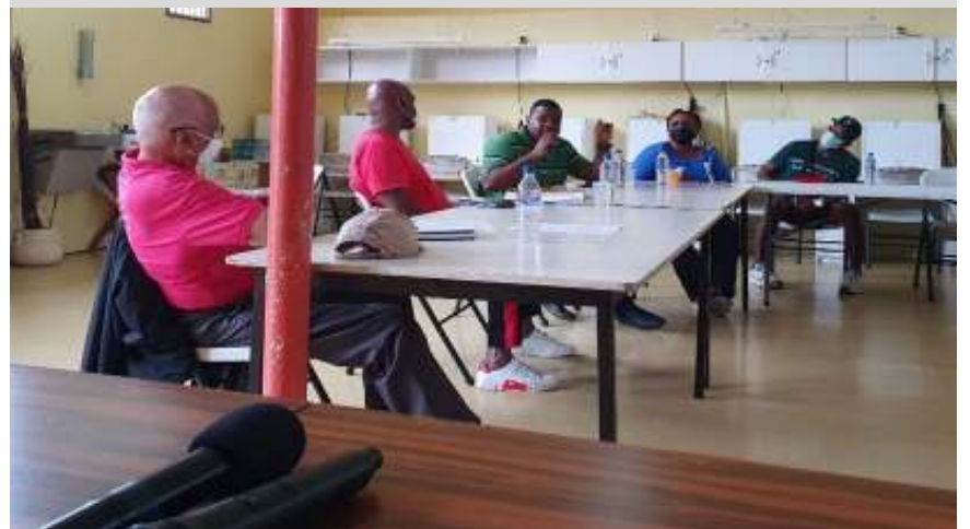
Retreat of Board and representatives of Auxiliaries on Saturday, January 23 rd 2021