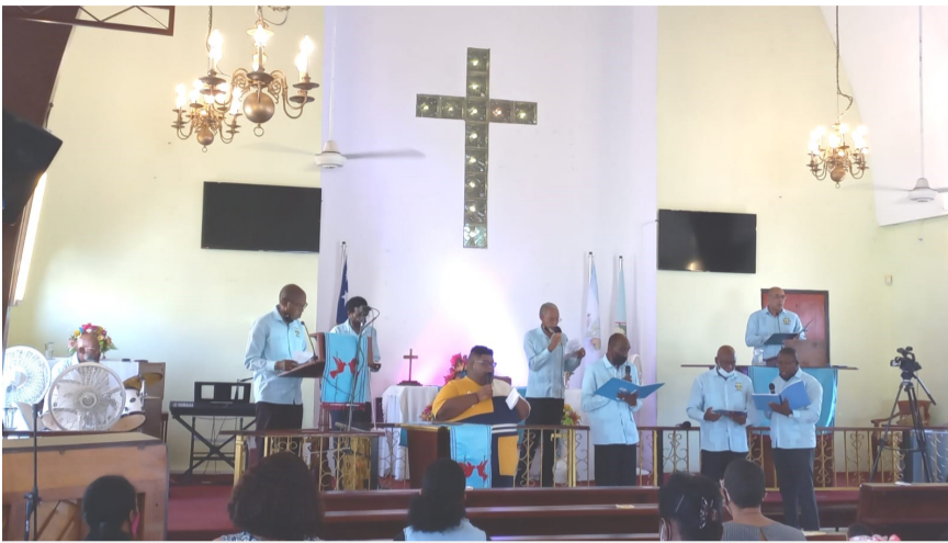
Ebenezer Men's Fellowship

On Sunday October 17 the Ebenezer men's fellowship was in charge and Br. Brodie brought the message. His meditation was entitled "How do we see ourselves when we are in the presence of God.?" God knows everything about us. In Jeremiah 1:5 God said : I knew you before I formed you in your mother's womb. God knows how we think, how we feel and he still loves us. Jesus Christ has given his life on the cross so we could be reconciled to God. Man looks at the outside appearance but God looks at the heart.