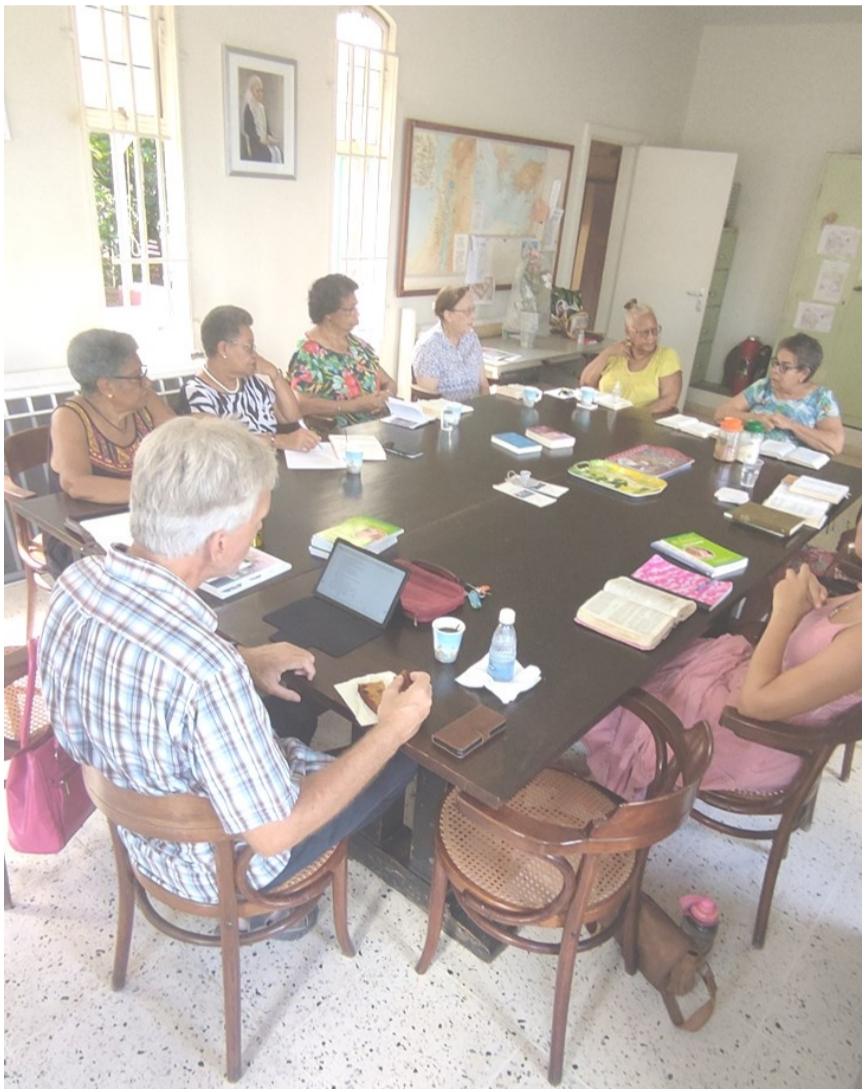
De koffieochtend in de Emmakerk